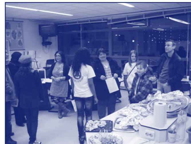
De talentontwikkeling trok de aandacht op de Open Dag.