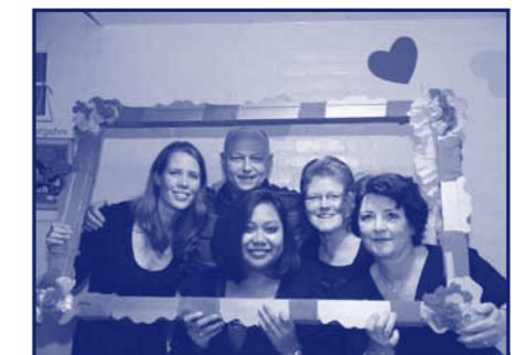
Ook het personeel uit Krimpen schitterde op het Valentijns gala.

Een dilemma is er wel mee geschapen voor de school: is dit een sectorwerkstuk, is dit een maatschappelijke stage of is het dat allebei? Het zal de leerlingen een zorg zijn, ze zijn dolenthousiast, ze stoppen er veel tijd in en betekenen iets voor een ander... Wat willen we nog meer?