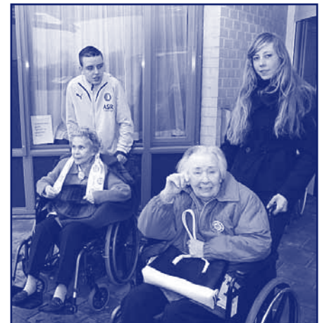
SDV-leerlingen in actie als vrijwilliger.