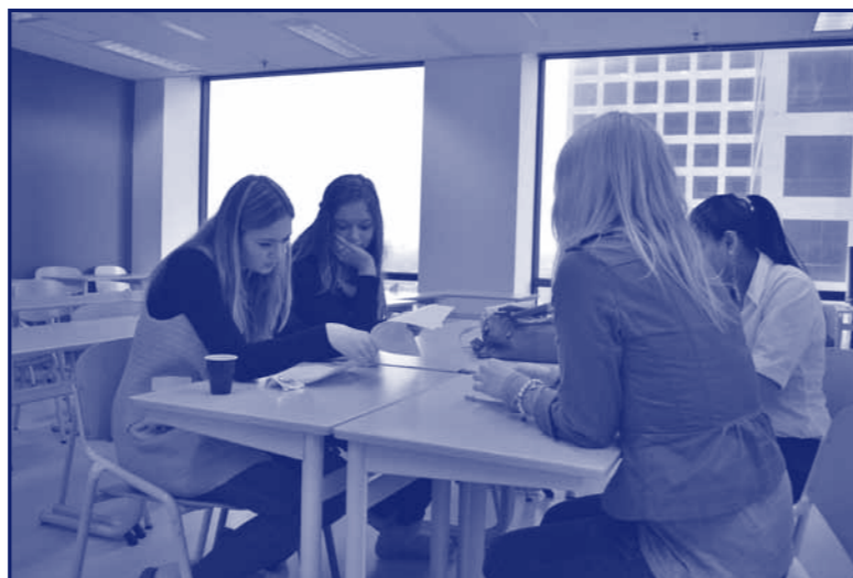
De drie dames bereiden zich voor op de voorronde.